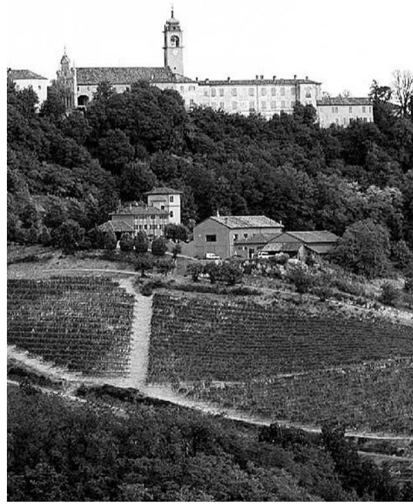
Sopra, un celebre ritratto fotografico di Cesare Pavese mentre accende la sua pipa. A sinistra, il Sacro Monte di Crea a Serralunga (Alessandria), spesso visitato dallo scrittore piemontese