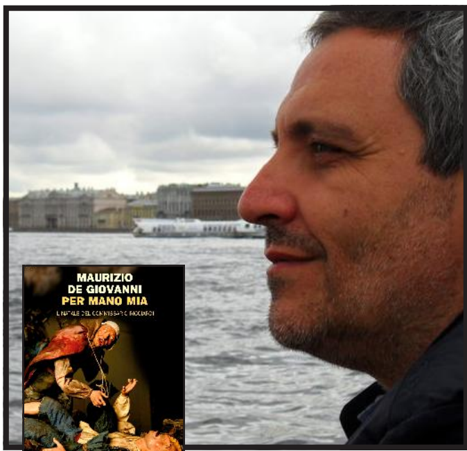
Maurizio De Giovanni torna in libreria

rio ma consapevole del dolore più enorme, quello che separa dalla vita con violenza, è convinto che le cose gravi e serie siano molto lontane dalle forme imposte dal regime. Non ha particolari acredine o contrapposizioni, come invece ad esempio il dottor Modo, perché non ha fiducia nello strumento politico fatto da uomini molto lontani dalla strada e dal dolore che la popola. Credo che dovendo esprimere un'opinione nel panorama contemporaneo sarebbe tendenzialmente anarchico, senza istanze di lotta di classe».