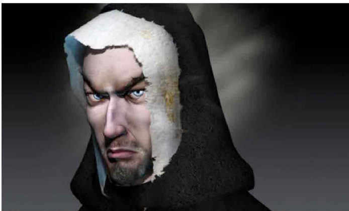
immagine tratta dal videogioco: Nicolas Eymerich, Inquisitor: the plague

“Posso solo dire che la storia comincia in Sicilia, nell'anno 1372, ed è intervallata da capitoli sulla vita di Eymerich bambino.”