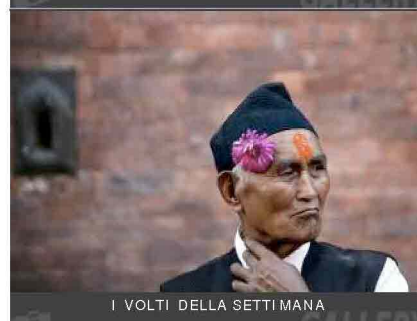
I VOLTI DELLA SETTIMANA