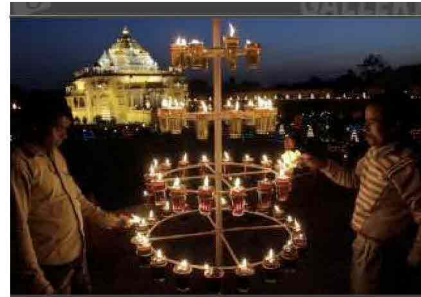
DIWALI, la festa indiana delle luci

Devi aver fatto log-in per inserire un commento.