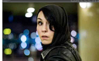
I misteri dell'ultimo lavoro di Larsson