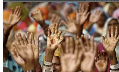
LE FOTO PIÙ BELLE DELLA SETTIMANA