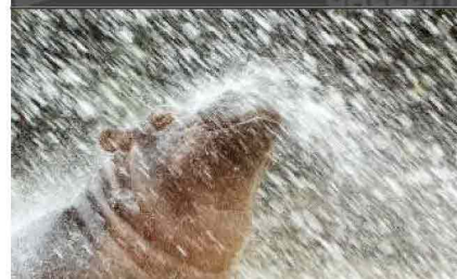
ANIMALI, le foto più belle