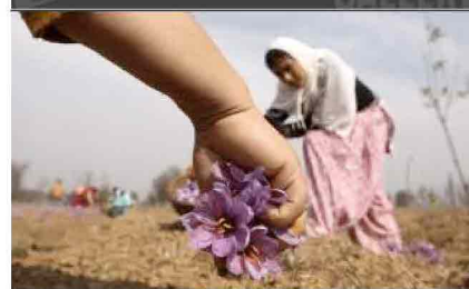
Kashmir, la raccolta dello zafferano