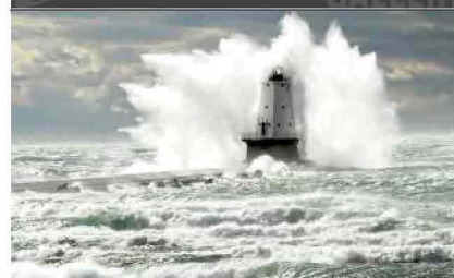
Farologia che passione: I FARI nelle foto più belle