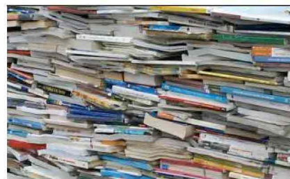
Le classifiche dei libri più venduti

Si conclude così un ciclo unico nella storia della letteratura, incentrato su un personaggio nero, violento, moralmente condannabile ma nel quale il lettore non può fare a meno di immedesimarsi. Un personaggio che ha cominciato a far scuola nel 1994, quando Evangelisti pubblicò Nicolas Eymerich, inquisitore . Un personaggio riuscito a dare una nuova