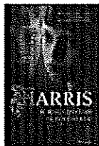
Joanne Harris Il ragazzo con gli occhi blu Garzanti pp. 457 € 18,60