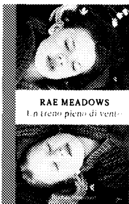
RAE MEADOWS Un treno pieno di vento