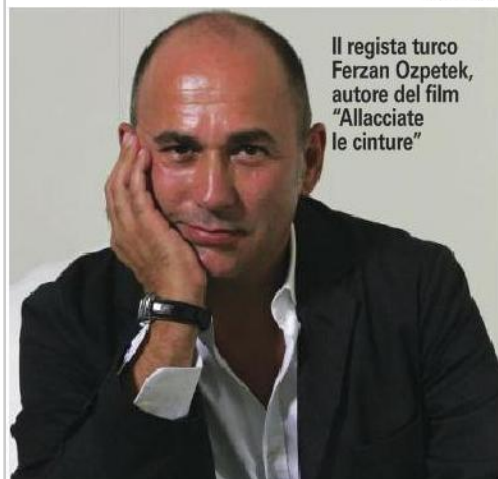
Il regista turco Ferzan Ozpetek , autore del film "Allacciate le cinture"

"Oggi face e per metà l' tore" non ho r manualità. La di me, non ha