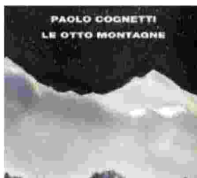
Il romanzo di Paolo Cognetti