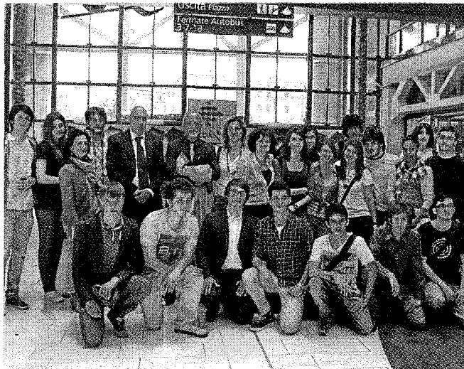
Foto di gruppo per gli studenti del «Calini» al Freccia Rossa

Gli altri appuntamenti in programma il 21 e il 23 maggio mentre il 26 c'è la serata finale