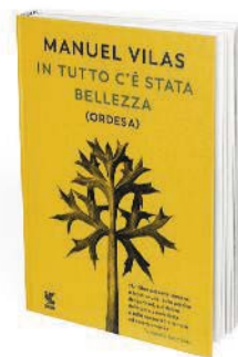
In tutto c'è stata bellezza , di Manuel Vilas, Guanda. Traduzione di Bruno Arpaia. Pagg. 400, 18 €

Realtà privata, familiare, nazionale: il romanzo è stato giudicato il capolavoro spagnolo del 2018, alla pari con Patria di Aramburu. Vilas prende dalla quotidianità – morte dei genitori, separazione, amore per i figli, la vita in Spagna – e ne trae una vicenda tagliente, pura e rabbiosa. Ci vuole talento, per esporre tutta la verità, e Vilas è così bravo che si finisce per perdonare anche la propria vita, futile o tormentata che sia.