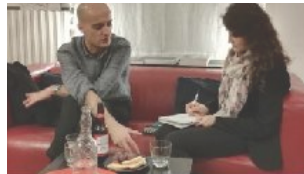
Forgione: "Il lavoro? Non più fatica ma status-symbol" 18 ottobre 2018 In "Interviste"