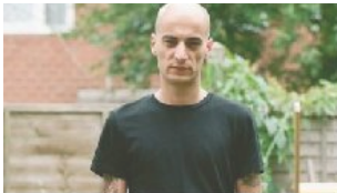
Accesso e uscita dalla realtà, è la Napoli di Forgione 19 ottobre 2018 In "Lecture"